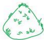
Tontes de pelouse