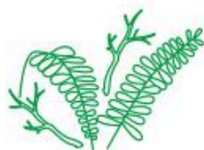
Brindilles vertes, fougères

Les paillis de courte durée de vie qui se dégradent en quelques semaines et produisent un humus actif et nutritif. La solution idéale pour le potager et les fleurs !